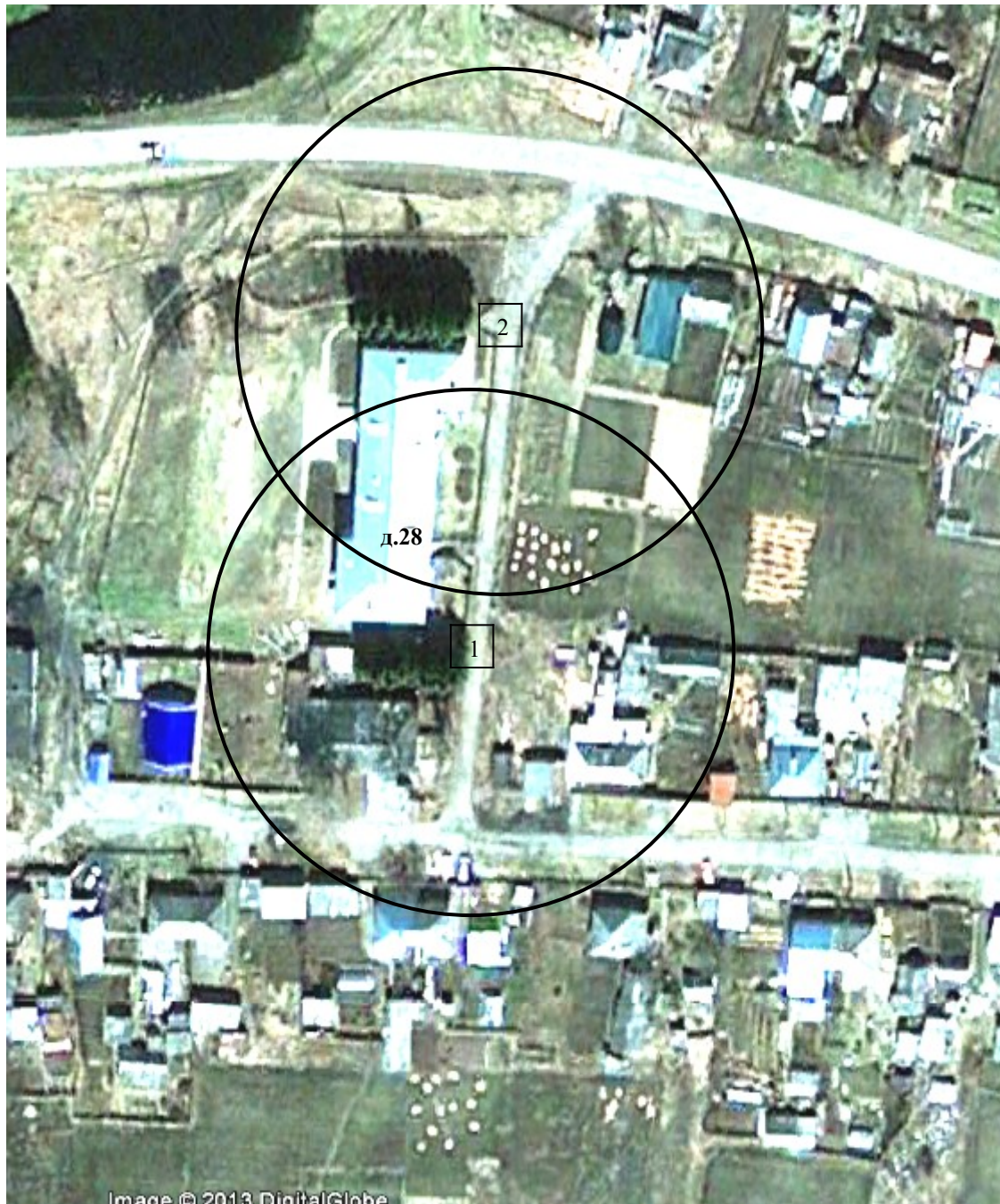
Схема 5. Здание Кандинской СОШ и детского сада. Томская область, Томский район, д.Кандинка, ул.Школьная, д.28. Зоны в радиусе 50 м от входа на территорию школы (1) и территорию детского сада (2).