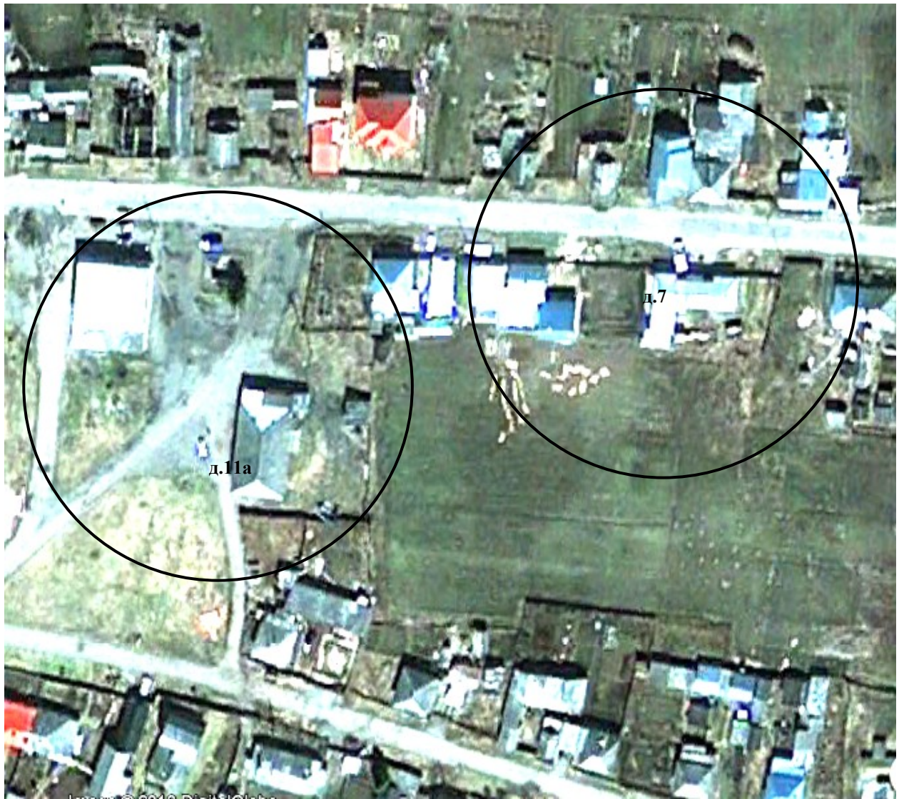
Схема 4. Здание Кандинского ФАП. Томская область, Томский район, д.Кандинка, ул.Советская, д.7. Зона в радиусе 50 м от входа в здание ФАП. Здание Кандинского ДК. Томская область, Томский район, д.Кандинка, ул.Советская, д.11а. Зона в радиусе 50 м от входа в здание ДК.