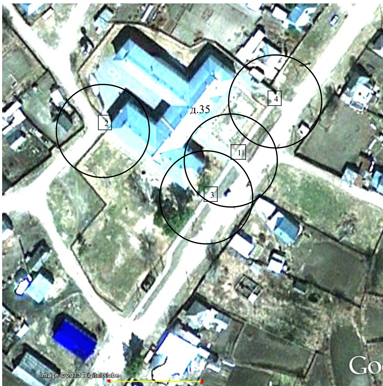
Схема 1. Здание Курлекской СОШ, детского сада и ФАП. Томская область, Томский район, с.Курлек, ул.Тракторная, д.35. Зоны в радиусе 50 м от входа на территорию школы (1,2), детского сада (3) и ФАП (4).

границ прилегающих территорий к организациям и объектам, расположенным на территории Калтайского сельского поселения, на прилегающей территории которых не допускается розничная продажа алкогольной продукции