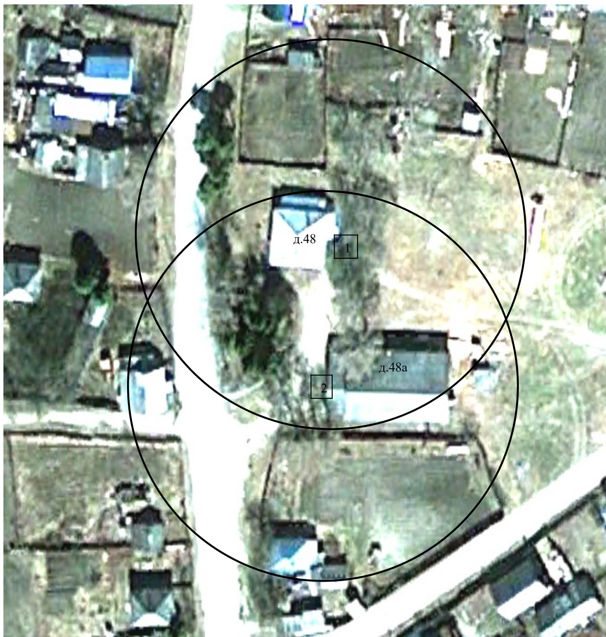
Схема 2. Здание Администрации Калтайского сельского поселения. Томская область, Томский район, с.Курлек, ул.Тракторная, д.48. Зона в радиусе 50 м от входа в здание (1).

Здание Курлекского клуба. Томская область, Томский район, с.Курлек, ул.Тракторная, д.48а. Зона в радиусе 50 м от входа в здание (2).