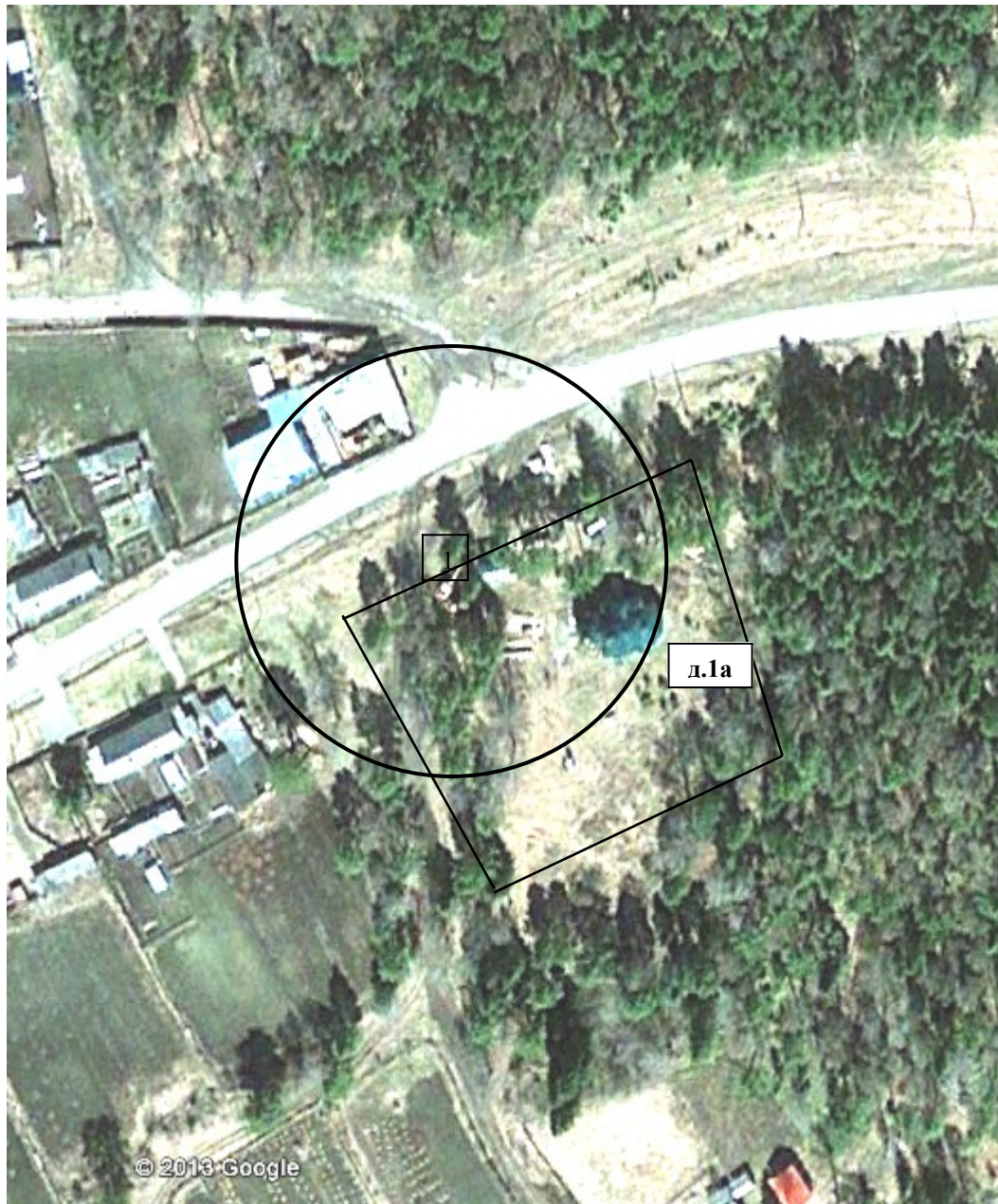
Схема 6. Здание Кандинской церкви. Томская область, Томский район, д.Кандинка, ул.Гагарина, д.1а. Зона в радиусе 50 м от входа на территорию церкви (1).